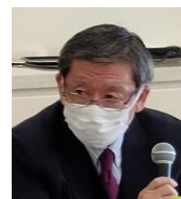
趣旨を説明する大場営業委員長

東関東生コン協同組合では、2022年1月26日開催の理事会において、「生コンクリート価格改定」を決定致しました。