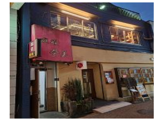
(ジャンソーアタル)

こちらは雀荘を改装したお店で入口は雀荘そのもので残っています。恐る恐る階段を登り、入口を入ると一瞬で恐怖心はなくなり、どこか異国チックで独特な雰囲気を出した店内が出現、入った感じは無機質風ですが、すぐに居心地いい空間になります。